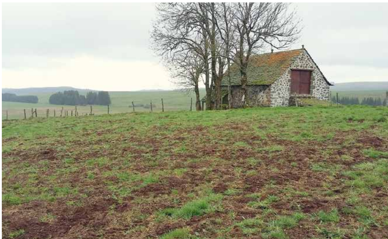
Pic de pullulation à Landeyrat en 2016. Estimation de 20 % de prairie pour 80 % de terre.

Ces vagues successives de pullulation ruinent moralement et économiquement les agriculteurs qui vivent sur ces territoires.