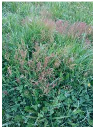
Houlque molle et rumex acetosela