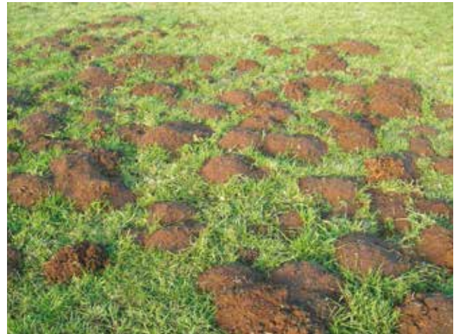
Tumuli de campagnols terrestres