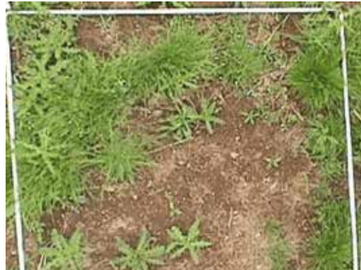
Chardons et pâturins annuels

Ci-dessous, 2 photos de prairies dégradées en cours de ré-engazonnement avec des plantes peu intéressantes agronomiquement.