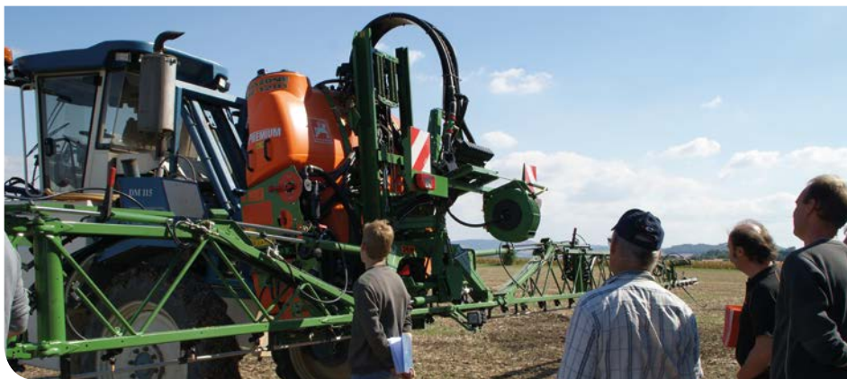
Journée AAC Pont-du-Château et Vinzelles - Agriculture de précision et intercultures : faites les bons choix - 20 septembre à Vertaizon, parcelle du GAEC Fourvel.

Sur les AAC de Pont-du-Château et Vinzelles, des journées ont été organisées, en 2015 sur le thème des moyens mécaniques de destruction et d'enfouissement des couverts végétaux, et en 2016 sur l'agriculture de précision.