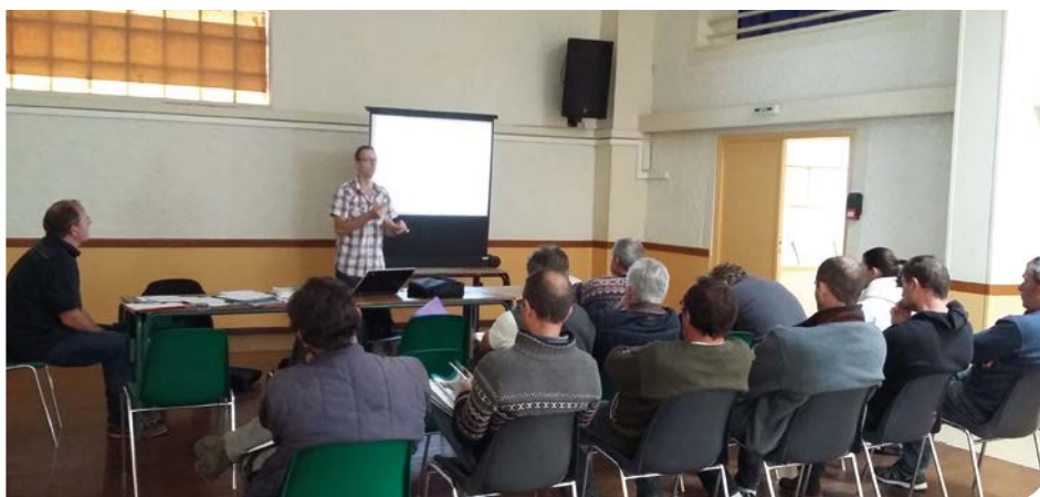
Réunion d'information en collaboration avec la FREDON Auvergne.

Vivement intéressés par les systèmes de traitement des produits phytosanitaires, une seconde rencontre abordant ce thème a eu lieu en collaboration avec la FREDON Auvergne.