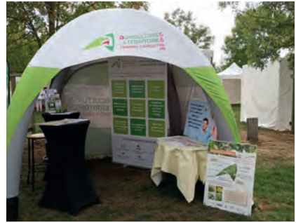
Plein'R - Vilars-les-Dombes