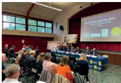
Conférence générale agricole - Thoiry

La conférence générale agricole annuelle est l'occasion de mettre en lumière plusieurs actions phares indispensables au développement de l'agriculture aindinoise. Le Département a une nouvelle fois renouvelé sa confiance et son soutien financier.